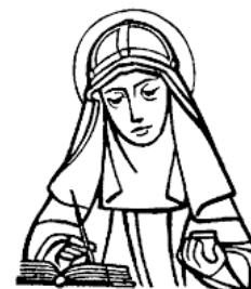
SANTA BRIGIDA religiosa