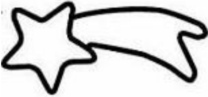
Stella cometa da attaccare sulla molletta