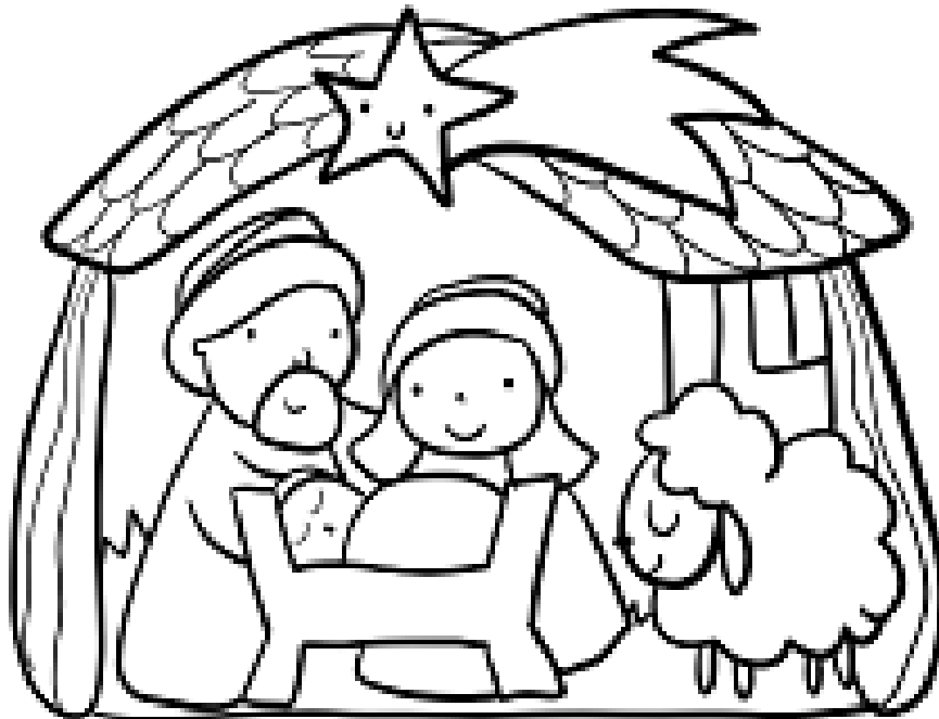
Capanna da attaccare sul calendario